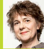
Ursula Nonnemacher Innenpolitische Sprecherin der Fraktion BÜNDNIS 90/DIE GRÜNEN im Brandenburger Landtag

„Das Volk übt seine Souveränität in Wahlen und Abstimmungen aus (GG Artikel 20 Abs. 2). Dazu müssen für Volksbegehren und -entscheide faire Bedingungen geschaffen werden und die Hürden überwindbar sein. Die Demokratie muss nicht vor dem Volk geschützt werden.“